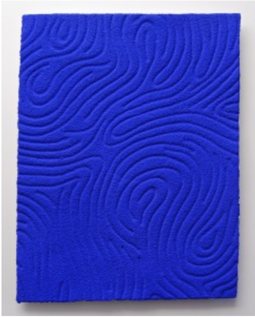
Pigment sur papier papier chiffon, Moulin de Larroque, 39x50cm 2012[/caption]

J'aime les contrastes, les aplats et la matière brute, j'aime cette confrontation, cette complémentarité.